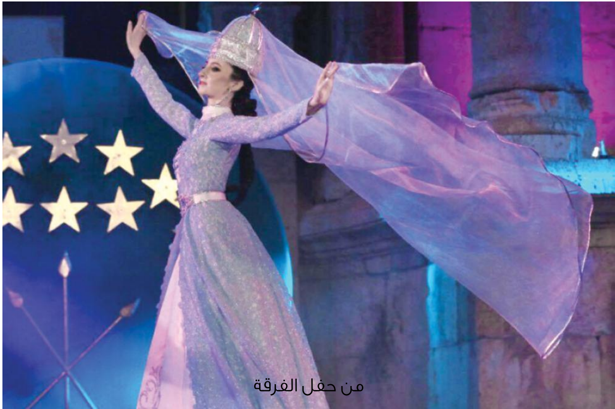
من حفل الفرقة